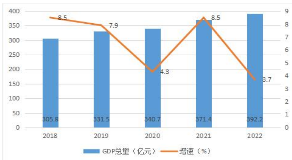
图 1：2018 年—2022 年通川区 GDP 增长情况