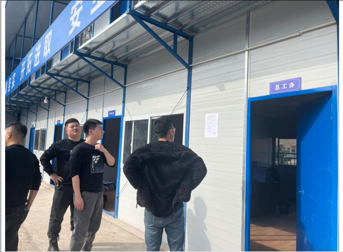
图 6 项目第二次公示截图（项目所在地张贴）