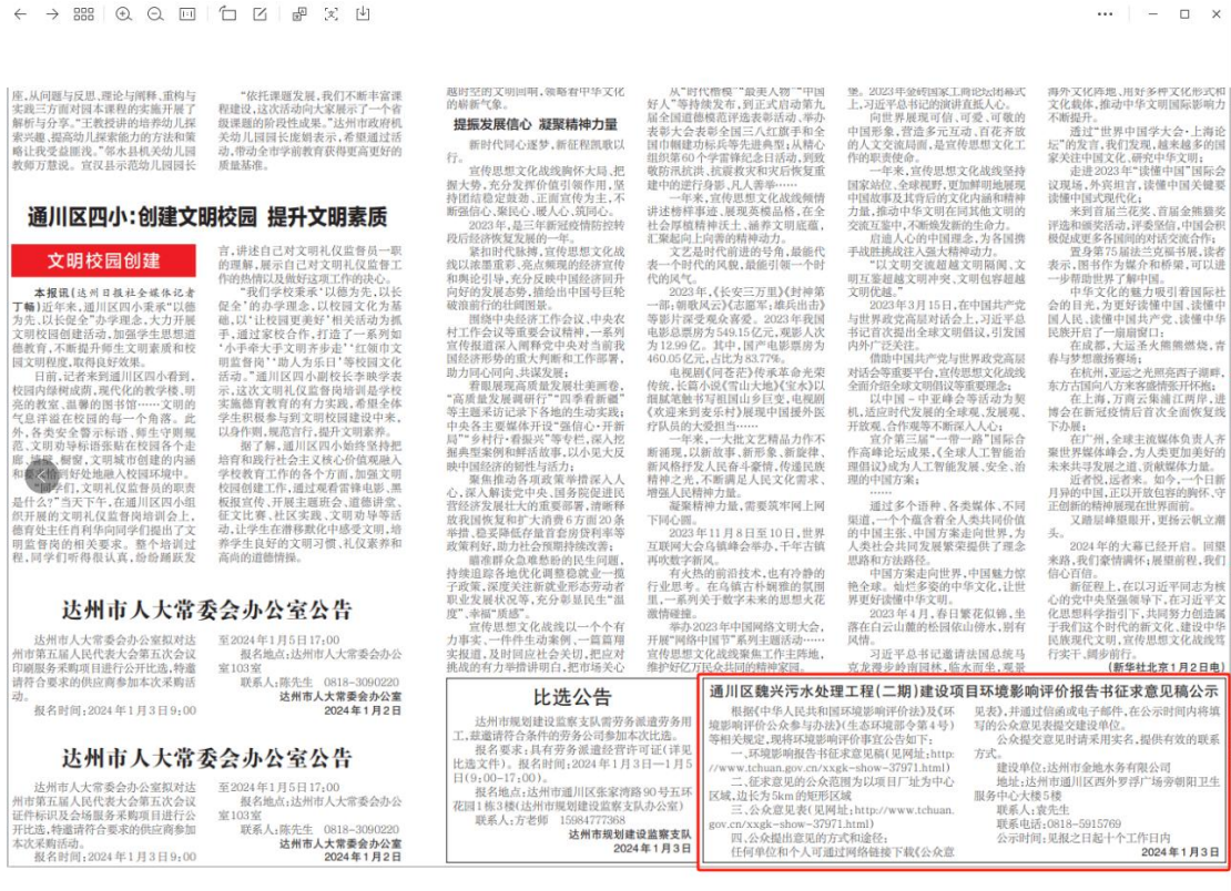
图4 项目第二次公示截图（第二次登报）