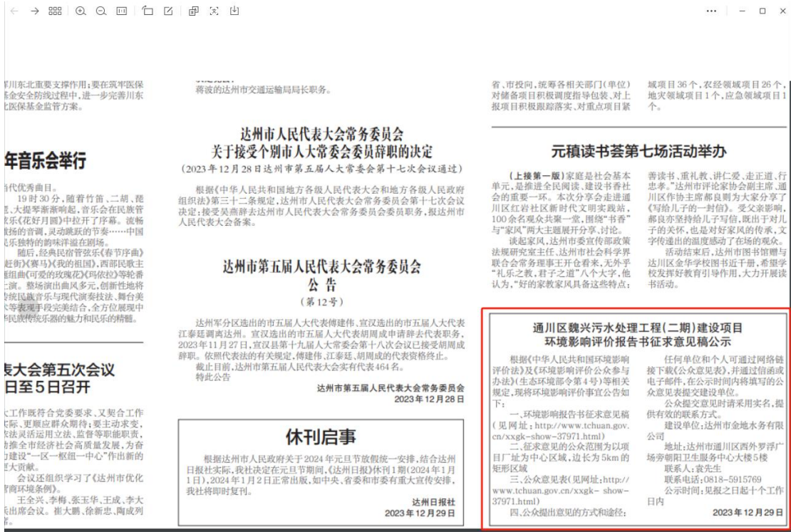
图3 项目第二次公示截图（第一次登报）