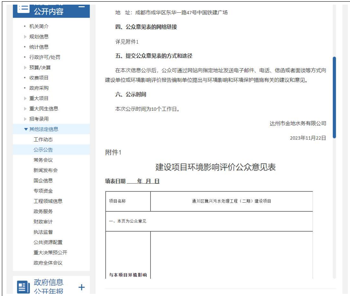
图 1 项目第一次网上公示截图