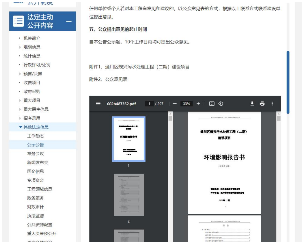
图 2 项目第二次公示截图（网络平台）